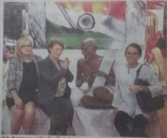
मेले में महात्मा गांधी की प्रतिमा के साथ सेल्फी लेती विदेशी दलकों।